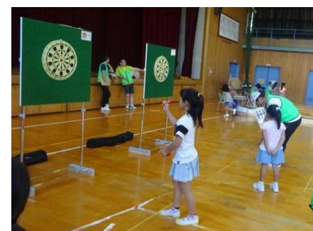
(②ふれあいスポーツ大会：6/16)