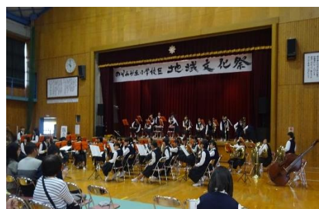
(オープニング：三国中吹奏楽部)