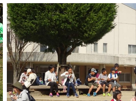
(昼食：あすなろの木ベンチ)