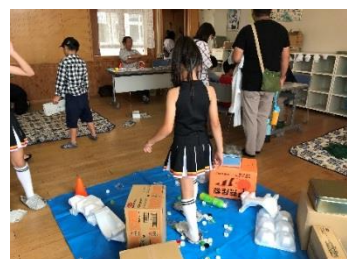
(新聞スリッパで危険な床を通過)