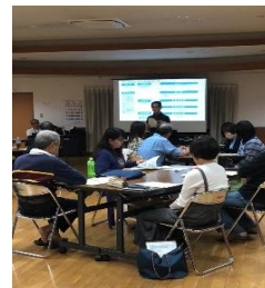
(防災マニュアルづくり)