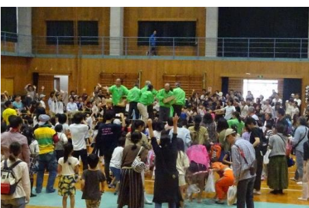
(フィナーレ：もちまき)