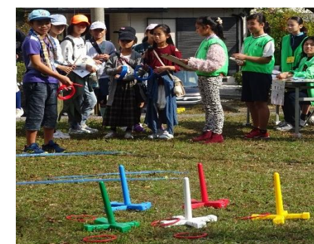
(輪投げ：三ツ枝公園)