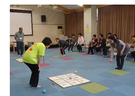
(レクリエーション：ナンバーボール)