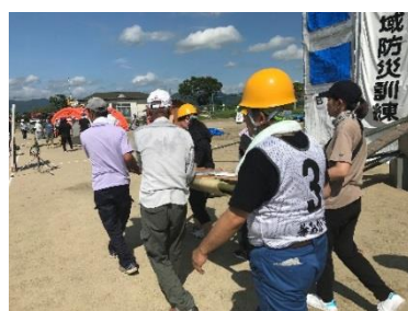
(広域防災訓練の様子)

災害時初動マニュアルの作成では、地震災害に備え両区の特徴をそれぞれ確認した上で、区の自主防災組織がどこまでの役割を担い、災害後いつまでにどのような優先順位で行うのか、そのために日頃からの準備には何が必要か、一つひとつ確認し、議論しています。