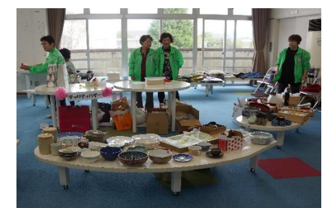
(校舎内：チャリティバザー)