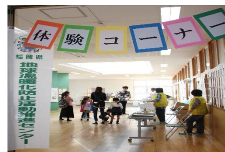
(校舎内：体験コーナー入口)