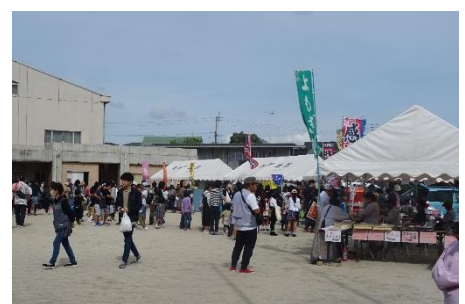
(校庭：売店の賑わい)