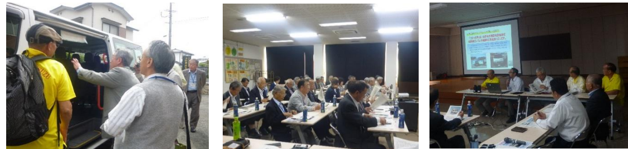
【5月8日福岡県古賀市区長会（50名）からの視察の様子】