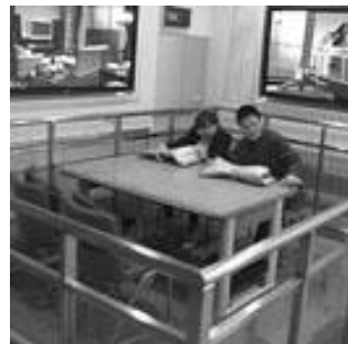
【福岡市防災センターでの地震体験の様子】

防災部会は、来年度に希みが丘区、美鈴が丘区合同の総合防災訓練を実施できるよう、本年度、自主防災組織の要となる両区の防災リーダーや区役員等を主な対象とした防災研修及び災害対応のイメージトレーニングを行います。