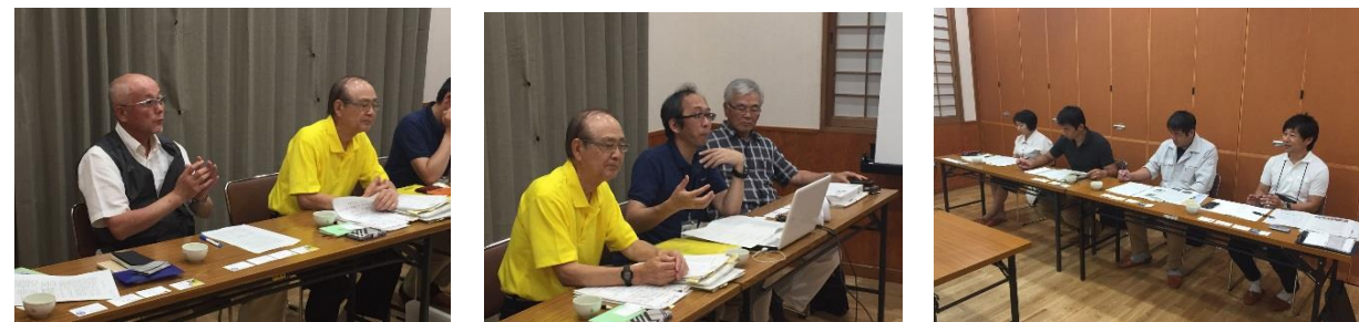
【6月30日大分県日田市議会（4名）からの視察の様子】

自治会バス「ベレッサ号」では、これまで全国からの視察や取材などが24回を数えるようになりました。最近、相次ぐ視察の対応でバタバタする状況が続いていますが、小郡市ののぞみ小校区の取り組みが、全国から注目されるようになって、遠くからも視察に来ていただけることは大変嬉しいことです。これからも、視察にお越しいただいた皆様に、「小郡市は素晴らしい！」と好印象を持って帰っていただけるよう、「お・も・て・な・し」の心で頑張ります。